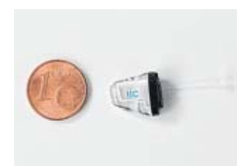
Unauffällig: Die Hörgeräte werden immer kleiner.

auch viele Kunden aus dem Norden der Stadt haben, wollten wir unseren Radius vergrößern und den Kunden mit dem zweiten Fachgeschäft am Meierteich entgegenkom-